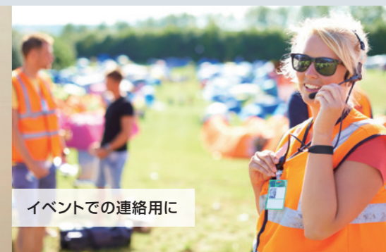
イベントでの連絡用に