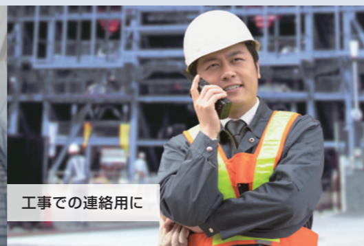
工事での連絡用に