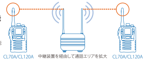
CL70A/CL120A 中継装置を経由して通話エリアを拡大 CL70A/CL120A