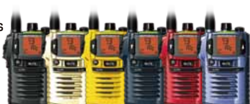
ブラック シルバー イエロー ネイビー レッド ブルー