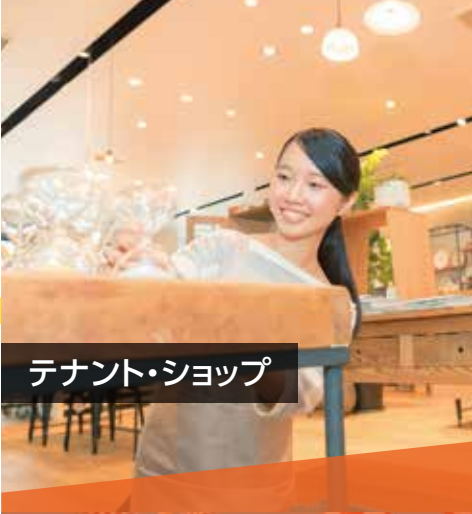
テナント・ショップ