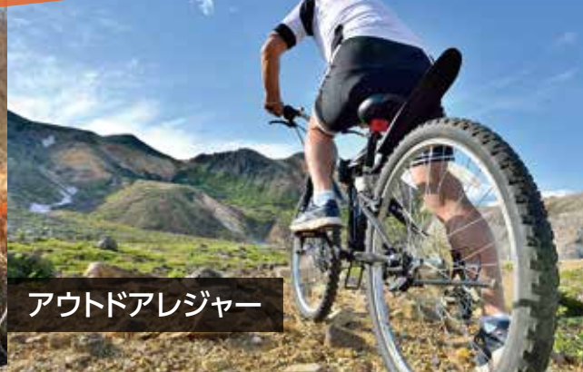
アウトドアレジャー