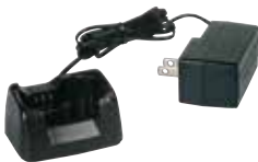
SBH-31 急速充電器 本体価格 2,800円(税抜)