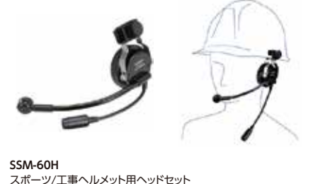
SSM-60H スポーツ/工事ヘルメット用ヘッドセット 本体価格13,200円(税抜)

ヘルメットに装着するタイプのヘッドセット ※本体との接続にはSCU-11が必要です。