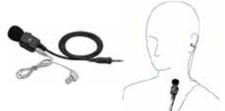
MH-62A4B タイプイヤホン(高感度タイプ) 本体価格6,500円(税抜)