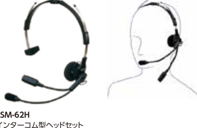
SSM-62H インターコム型ヘッドセット 本体価格4,800円(税抜)

ヘルメットに装着するタイプのヘッドセット ※本体との接続にはSCU-11が必要です。