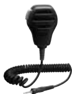
MH-73A4B 防浸型スピーカーマイク 本体価格5,200円(税抜)