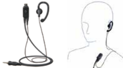
EK-313-107 小型タイプイヤホンタイプ 本体価格7,500円(税抜)