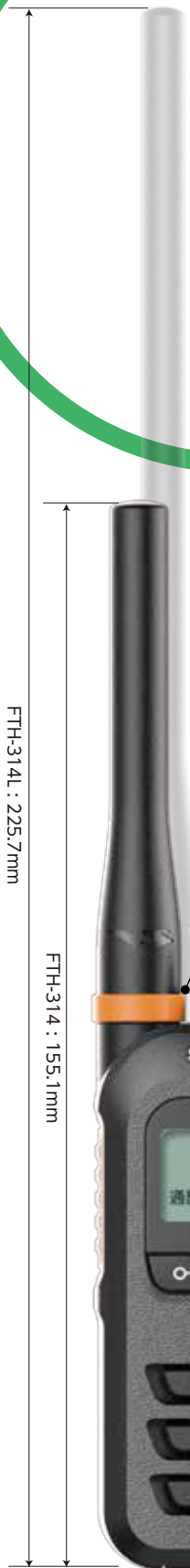
原寸大 (バックはロング アンテナモデル)

本製品はオーディオコネクタのキャップを開めた状態でIP67となり、それ以外の場合IP65となります。