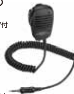
MH-57A4B スピーカーマイク 本体価格4,700円(税抜)