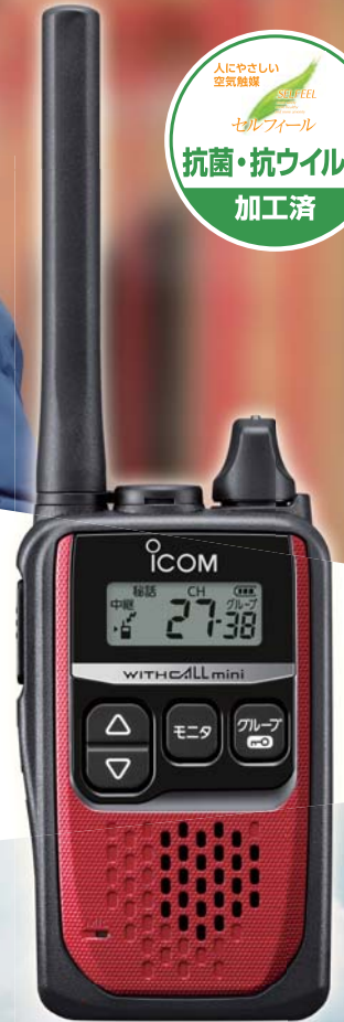
レッド JANコード: 4909723151968