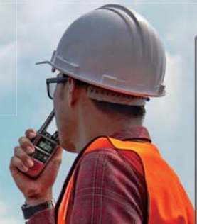
ブラック JANコード: 4909723151944