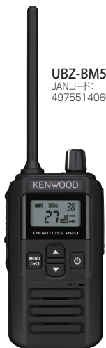
UBZ-BM51 JANコード: 4975514066308