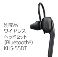
別売品 ワイヤレス ヘッドセット (Bluetooth®) KHS-55BT

UBZ-BM51BTはBluetooth®を搭載。PTT付きワイヤレスヘッドセットKHS-55BTに対応。KHS-55BTは、PTTモードとPTTホールドモードおよびVOX運用が可能で、PTTモードでは無線機本体のPTTと同じ操作感で使えます。ケーブルを気にすることなく運用できます。