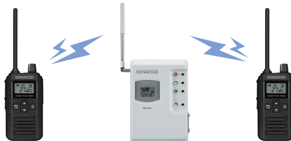
特定小電力中継器UBZ-RJ27

別売の中継器「UBZ-RJ27」と組み合わせることで、広い工場、倉庫などの広範囲なエリアでの交信が可能になります。20chのシンプルモードに加え、27chのレピーターアクセスモード（セミデュプレックスモード）に対応しています。