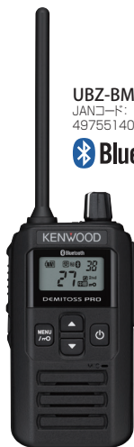
UBZ-BM51BT JANコード: 4975514066315